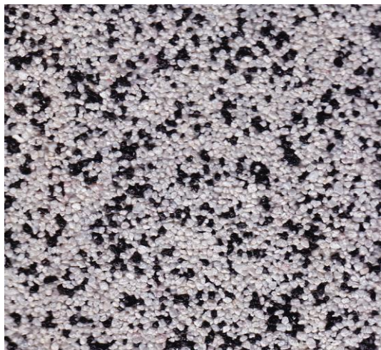
Bílý : černý 8:2