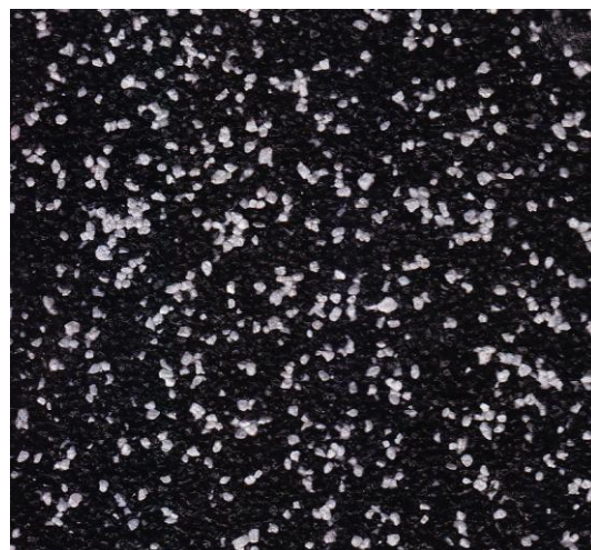
Bílý : černý 2:8

Melíry do prodejních balení jsou míseny podle objednávky zákazníka. Obvyklé poměry jsou 1:9, 2:8, 3:7, 4:6, 5:5 (1:1), 6:4, 7:3, 8:2 a 9:1. Je možné zakoupit i jednotlivé obarvené písků zvlášť a namíchat si vlastní melíry s postupnou změnou. Tím například můžete vytvořit plochu začínající v bílé barvě a pak postupně melír měnit tak, že plocha končí v barvě černé.