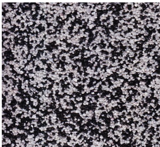
Bílý : černý 6:4