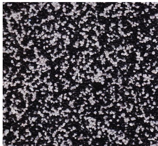
Bílý : černý 4:6